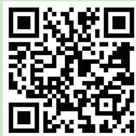
경기가야금앙상블 유튜브 바로가기

경기가야금앙상블 제1집 “가야금으로 듣는 우리노래 ( 예술기획 탑, 서울음반) 경기가야금앙상블 제2집 “특별한 초대” (서울음반) 경기가야금앙상블 제3집 25현가야금 창작 연주집 “청춘을 산책하다” (예술기획 탑) 경기가야금앙상블 연주곡집 (혜성출판사) 경기가야금앙상블 제4집 “산조탐닉” (악당이반) 경기가야금앙상블 제5집 “산조탐닉 2” (예술기획탑) 멜론,벅스,지니, 유튜브뮤직,애플뮤직 등에서 음원 스트리밍 되고 있습니다. 유튜브에서 “경기가야금앙상블” 을 검색해주세요. 최신 공연을 보실수 있습니다.