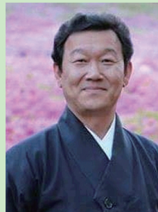
사회 / 한 덕택

국가 무형 문화재 제1호 종묘 제례악 이수자 국악교육학회 이사 한국전통문화원 이사 성남시립국악단 상임지휘자 용인대학교 국악과 교수